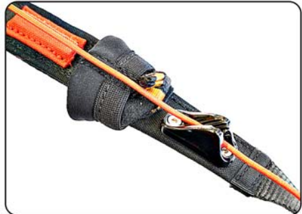
Couverture de sécurité en néoprène