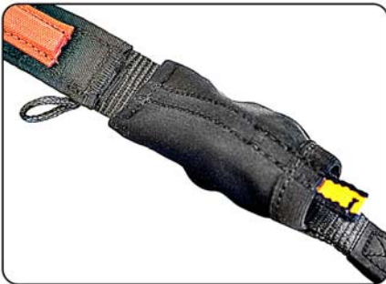
Couverture de sécurité en néoprène

AVIS : La suspente extérieure A est divisée en deux parties (A0 et A1) pour permettre une réparation rapide et facile si la gaine de la suspente A0 est endommagée. La suspente A0 est constituée de Liros TSL500, la longueur après couture est de 70,0cm (valable pour toutes les tailles de Pasha 7).