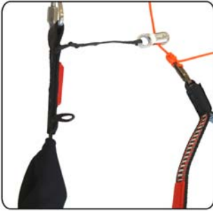
Position supérieure de la poulie de guidage du frein