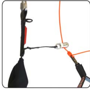
Position inférieure de la poulie de guidage du frein